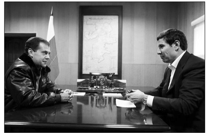
» Дмитрий Медведев положительно оценил опыт Челябинской области